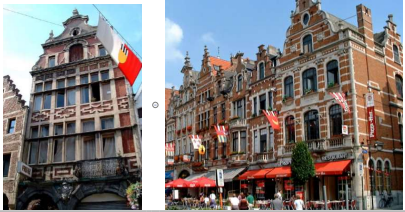
1650 Baroque Surcharge ornementale, fronton triangulaire, briques rouges et pierres de taille