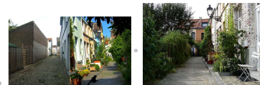
Habitat ouvrier Façade (environ 5 m de large), une fenêtre au rez de chaussée et deux à l'étage