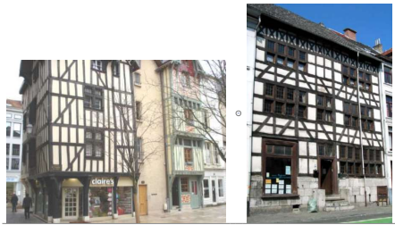
Jusqu'en 1600 Médiéval Colombage et encorbellement