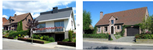
1980 Villa Quatre façades