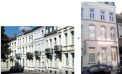
1850 Néoclassique Sobriété et façades enduites à la chaux