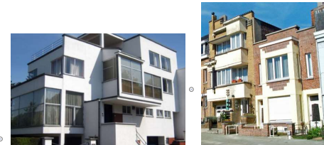
1930 Moderniste Habitat fonctionnel