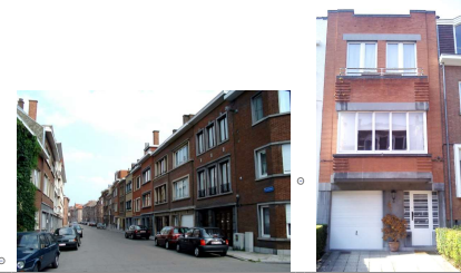
1950 Bel étage Bandeau de fenêtres et garage au rez-de-chaussée