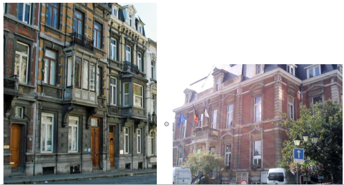
1850 à 1900 Eclectique Décors riches, aux nombreux héritages (baroque, classique, ...)