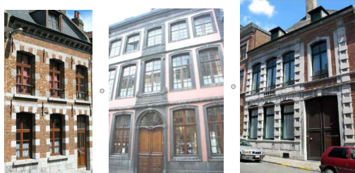
1750 Classique Sobriété et symétrie, briques et pierres de taille