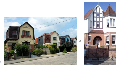
1920 Art déco Lignes droites et formes géométriques